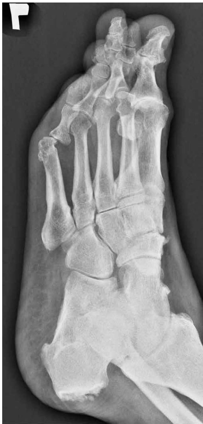
Fig. 6. Oblique X-ray shows a calcaneal spur (detailed evaluation on lateral radiograph), calcification adjacent to the outline of the navicular bone, degenerative changes of the forefoot

Ryc. 6. Obraz RTG przedstawia ostrogę piętową górną na zdjęciu skośnym (dokładna ocena na zdjęciu bocznym), zwapnienie przy zarysie kości łódkowatej, zmiany zwyrodnieniowe w obrębie kości przodostopia