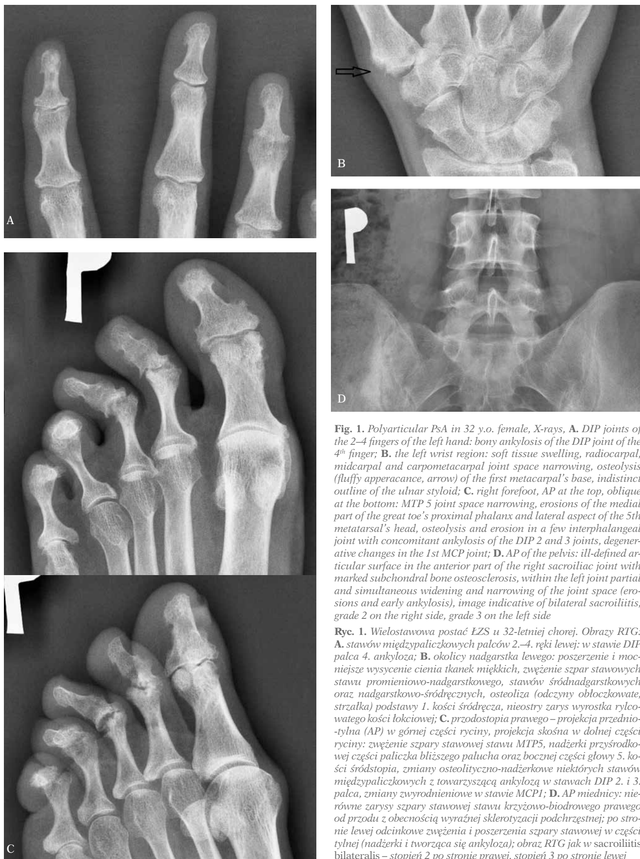
Fig. 1. Polyarticular PsA in 32 y.o. female, X-rays, A. DIP joints of the 2–4 fingers of the left hand: bony ankylosis of the DIP joint of the 4 th finger; B. the left wrist region: soft tissue swelling, radiocarpal, midcarpal and carpometacarpal joint space narrowing, osteolysis (fluffy appearance, arrow) of the first metacarpal's base, indistinct outline of the ulnar styloid; C. right forefoot, AP at the top, oblique at the bottom: MTP 5 joint space narrowing, erosions of the medial part of the great toe's proximal phalanx and lateral aspect of the 5 th metatarsal's head, osteolysis and erosion in a few interphalangeal joints with concomitant ankylosis of the DIP 2 and 3 joints, degenerative changes in the 1st MCP joint; D. AP of the pelvis: ill-defined articular surface in the anterior part of the right sacroiliac joint with marked subchondral bone osteosclerosis, within the left joint partial and simultaneous widening and narrowing of the joint space (erosions and early ankylosis), image indicative of bilateral sacroiliitis, grade 2 on the right side, grade 3 on the left side

Ryc. 1. Wielostawowa postać EZS u 32-letniej chorej. Obrazy RTG: A. stawów międzypaliczkowych palców 2.–4. ręki lewej: w stawie DIP palca 4. ankyloza; B. okolicy nadgarstka lewego: poszerzenie i mocniejsze wysycenie cienia tkanek miękkich, zwężenie szpar stawowych stawu promieniowo-nadgarstkowego, stawów śródnadgarstkowych oraz nadgarstkowo-śródręcznych, osteoliza (odczyny obłoczkowate, strzałka) podstawy 1. kości śródręcza, nieostry zarys wyrostka rylcowatego kości łokciowej; C. przodostopia prawego – projekcja przednio-tylna (AP) w górnej części ryciny, projekcja skośna w dolnej części ryciny: zwężenie szpary stawowej stawu MTP5, nadżerki przyśrodkowej części paliczka bliższego palucha oraz bocznej części głowy 5. kości śródstopia, zmiany osteolityczno-nadżerkowe niektórych stawów międzypaliczkowych z towarzyszącą ankylozą w stawach DIP 2. i 3. palca, zmiany zwyrodnieniowe w stawie MCP1; D. AP miednicy: nierówne zarysy szpary stawowej stawu krzyżowo-biodrowego prawego od przodu z obecnością wyraźnej sklerotyzacji podchrzęstnej; po stronie lewej odcinkowe zwężenia i poszerzenia szpary stawowej w części tylnej (nadżerki i tworząca się ankyloza); obraz RTG jak w sacroiliitis bilateralis – stopień 2 po stronie prawej, stopień 3 po stronie lewej