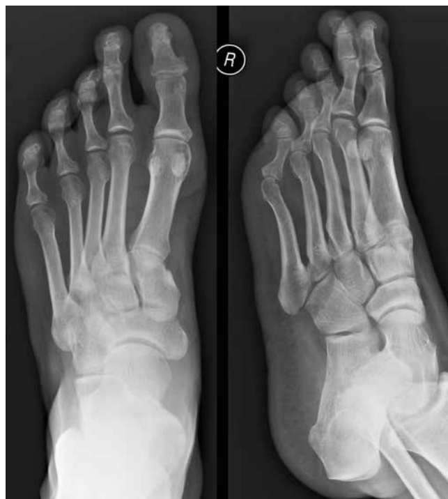
Fig. 3. Foot radiograph of the 42 y.o. male patient with PsA, AP on the left, oblique on the right: osteoporosis, well-defined area of the decreased bone density in the medial part of the big toe's proximal phalanx, uneven outline of the big toe's distal bony phalanx with inflammatory cysts and medial erosion, increased bone density of the distal phalanx of the big toe ( ivory phalanx )

Early erosive changes are quite common in PsA – they develop in 15–47% of patients within first two years of a dis-