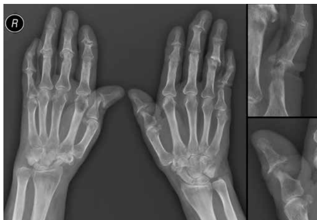
Fig. 2. X-ray of the hands of the 53 y.o. female patient with PsA and erosive osteoarthritis, on the left – AP, on the right – PIP joint of the 5 th left finger and IP joint of the left thumb enlarged: soft tissue swelling of the ulnar side of the left wrist, malalignment of the DIP joint of the 2 nd finger of the right and 3 rd finger of the left hand, subluxation of the IP joint of the right thumb and left hand's PIP 4 joint, joint space narrowing in a few interphalangeal joints and in both wrist regions, with concomitant destructive changes and decreased distance between articular surface of the distal radius and the base of the 3 rd metacarpal on the right side, gross and juxtaarticular osteoporosis, destructive changes in a few PIP and DIP joints (gull-wing appearance, erosive osteoarthritis), osteolytic and erosive lesions (stuffy appearance in the course of PsA) in PIP joint of the 5 th left finger and IP joint of the left thumb, with proximal phalangeal shortening (telescoping of finger), degenerative cyst in the head of the proximal phalanx of the 4 th left finger, erosion on the lateral side of the base of the proximal phalanx of the 2 nd right finger

Ryc. 2. RTG rąk 53-letniej chorej na ŁZS i postaci nadżerkową choroby zwyrodnieniowej stawów; strona lewa – projekcja AP, strona prawa – staw PIP palca 5. ręki lewej i IP kciuka lewego w powiększeniu: poszerzenie i mocniejsze wysycenie cienia tkanek miękkich okolicy nadgarstka od strony łokciowej, nieprawidłowe ustawienie w stawach DIP palca 2. ręki prawej oraz palca 3. ręki lewej, podwichnięcie w stawie IP kciuka prawego oraz PIP 4 ręki lewej, zwężenie szpary stawowej niektórych stawów międzypaliczkowych rąk oraz stawów okolicy nadgarstków, po stronie prawej z towarzyszącymi zmianami destrukcyjnymi oraz zmniejszeniem odległości między powierzchnią stawową dystalnej części kości promieniowej a powierzchnią stawową podstawy 3. kości śródreza, osteoporoza uogólniona i przystawowa, zmiany destrukcyjne niektórych stawów PIP i DIP (objaw mewy, postać nadżerkowa choroby zwyrodnieniowej), zmiany osteolityczno-nadżerkowe (odczyny obłoczkowate w przebiegu ŁZS) stawu PIP palca 5. ręki lewej oraz stawu IP kciuka lewego, ze skróceniem jego paliczka bliższego (palec teleskopowy), torbiel zwyrodnieniowa głowy paliczka bliższego palca 4. ręki lewej, nadżerka bocznej części podstawy paliczka bliższego palca 2. ręki prawej