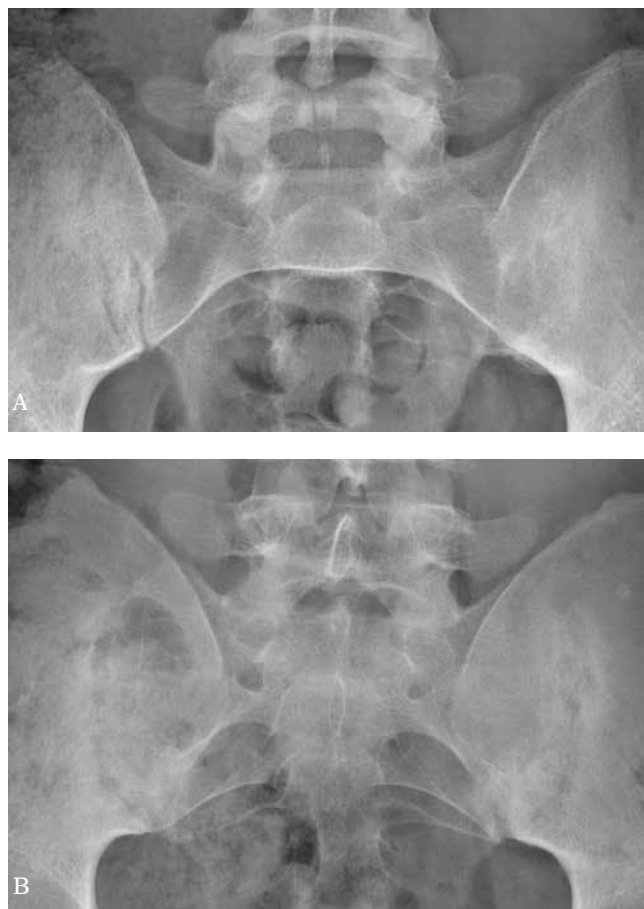
Fig. 5. AP radiograph of the sacroiliac joints: A. bilateral sacroiliitis, grade 2 on the right, grade 4 on the left, spina bifida of the last lumbar vertebra and S1; B. ill-defined articular surface of the sacroiliac joints and subchondral bone osteosclerosis, partial and simultaneous widening and narrowing of the joint space (erosions and early ankylosis), image indicative of bilateral sacroiliitis, grade 3

Significant size, asymmetric distribution with skipped vertebral bodies levels, or sometimes unilateral, and separation from the lateral aspect of the vertebral bodies are the main radiographic features differentiating psoriatic syndesmophytes (para-syndesmophytes) from