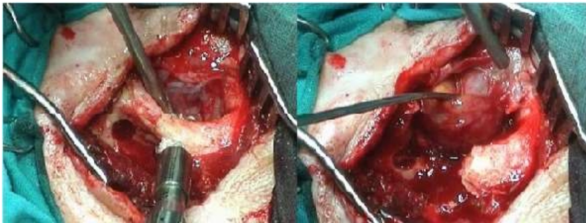
Ryc. 1. Orbitotomia boczna wykonywana z użyciem wysokoobrotowej wiertarki i kraniotomu do cięcia kości. Fig. 1. Lateral orbitotomy with use of high-speed drill for bone cutting.

Oceny skuteczności leczenia i uzyskanych efektów kosmetycznych w operowanej grupie pacjentów dokonaliśmy w przedziale 6–25 miesięcy od zabiegu operacyjnego (tab. I).