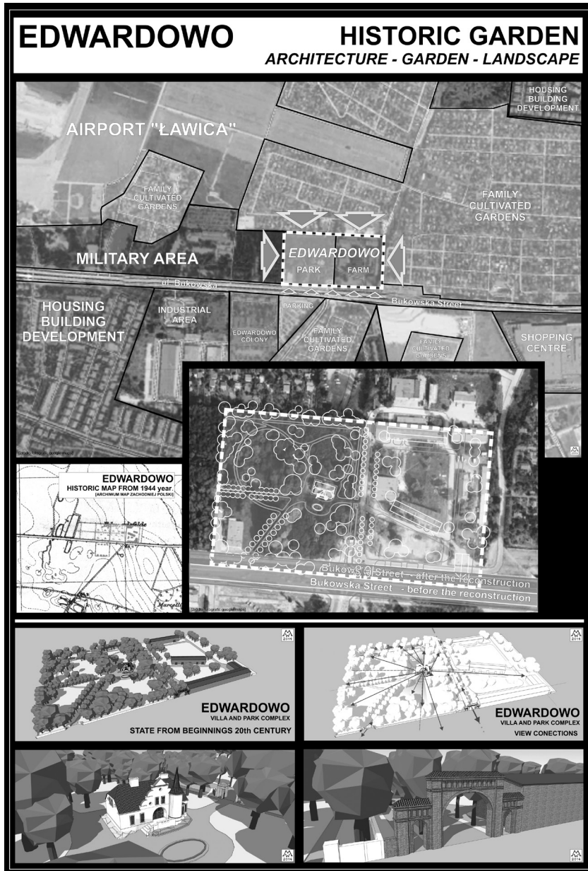
III. 2. The analysis of land use in close proximity to the estate. 3D model of the Edwardowo estate – general view of the estate and close-ups to mansion and historical gate (edited by M. Walerzak 2014)

II. 2. Analiza funkcjonowania terenów w bliskim sąsiedztwie Edwardowa oraz kompilacja stanu istniejącego i ideogramu rekonstrukcji. Model zespołu dworsko-parkowego w Edwardowie. Widok ogólny obiektu w perspektywie oraz widok na dwór i główną bramę (oprac. M. Walerzak 2014)