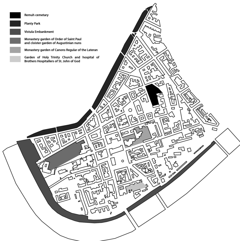
III. 1. Location of green areas in the old Kazimierz district (edited by J. Klimek)