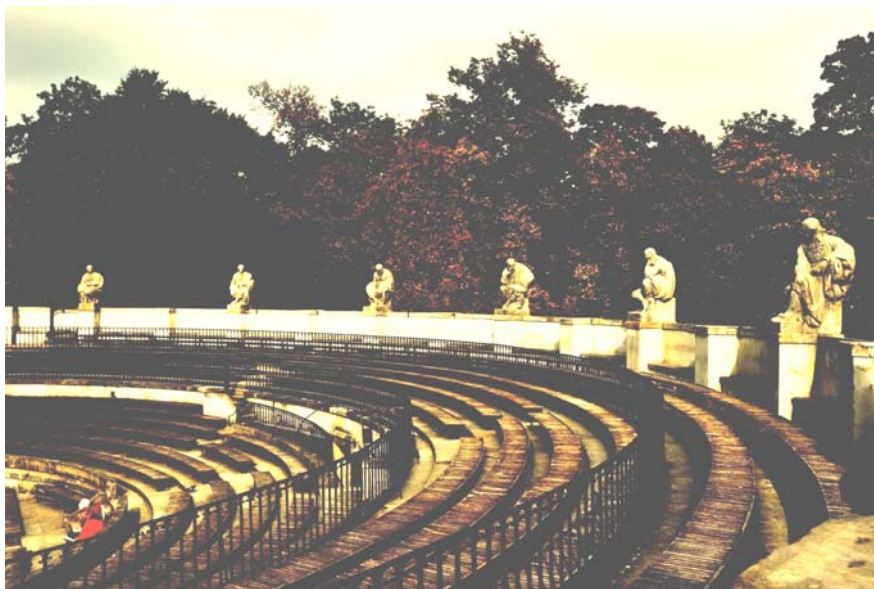
Ryc. 1. Widownia Amfiteatru, Łazienki królewskie, Warszawa (fot. M. Janicka 2011)

Rzeźby występują w największym skupieniu w otoczeniu najbardziej reprezentatywnych budynków – Pałac na Wodzie, Stara Pomarańczarnia, Biały Domek oraz w otoczeniu amfiteatru. Ustawiane były symetrycznie, celem podkreślenia układu ważniejszych kierunków kompozycyjnych (ryc. 1).