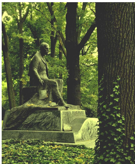
Ryc. 2. Pomnik Henryka Sienkiewicza, Łazienki królewskie, Warszawa

W ogrodzie łazienkowskim poza rzeźbami nawiązującymi do antyku czy symboli spotykamy rzeźby przedstawiające ludzi zasłużonych dla kraju i narodu, na polu nauki, pracy społecznej, sztuki i literatury (ryc. 2). Upamiętnienie tych zasług ma duże znaczenie edukacyjne zwłaszcza w wyniku powiązania rzeźby z otoczeniem – rezydencją królewską [Kwiatkowski 2000].