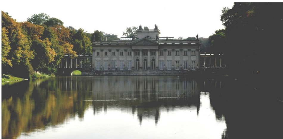
Ryc. 7. Elewacja północna, Pałac na Wyspie, Łazienki królewskie, Warszawa