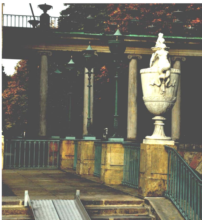
Ryc. 3. Waza, Łazienki królewskie, Warszawa

W pałacu i jego otoczeniu obok rzeźb figuralnych przedstawiających alegorie czterech pór roku, czterech części świata i czterech żywiołów spotkać można rzeźby Marsa i Minerwy, a także popiersi cesarów rzymskich zdobiących mosty arkadowe. Głównymi rzeźbami na tarasie południowym przed pałacem są dwie dynamiczne figuralne rzeźby na cokole usytuowane po bokach fontanny. Jest to Nimfa chwytająca winne grono z ręki satyra oraz Hermafrodyta odtrącająca Salmacydę. W narożnikach południowych tarasu znajdują się dwie alegoryczne figury przedstawiające Wisłę i Bug (wykonane przez Ludwika Kaufmana) [Majdecki 1969]. Od południowej strony w bezpośrednim sąsiedztwie Pałacu na Wodzie znajdują się marmurowe rzeźby oparte na wzorach antycznych. W linii schodów prowadzących do pałacu ustawiono dwie wazy ozdobione figurami syren i delfinów (ryc. 3). Obok waz w bocznych aneksach wyżej położonego tarasu znajdowały się dwie rzeźby figuralne, których autorem był Le Bruno.