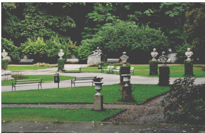
Ryc. 4. Popiersia cesarów rzymskich, Łazienki królewskie, Warszawa (fot. M. Janicka 2011)

Dużym skupieniem form rzeźbiarskich charakteryzował się również amfiteatr zwany teatrem na wyspie. Zarówno scena, jak i widownia były bogato zdobione elementami rzeźbiarskimi. Charakterystyczny dla tej budowli był zespół rzeźb wieńczących amfiteatr. Nawiązują one do najwybitniejszych dramaturgów świata.