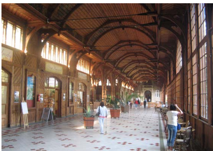
Fot. 2. Hala spacerowa w Świeradowie Zdrój Phot. 2. Hall in Świeradowie Zdrój