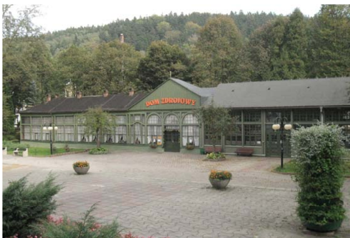
Fot. 3. Drewniane hale spacerowe w Długopole