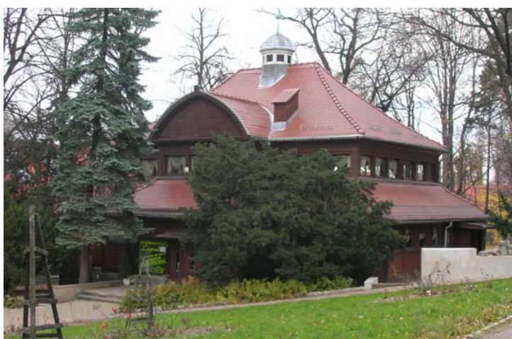
Fot. 6. Restauracja „Legenda” w Szczawnie Zdroju

Phot. 6. Restaurant “Legenda” in Szczawnie Zdrój