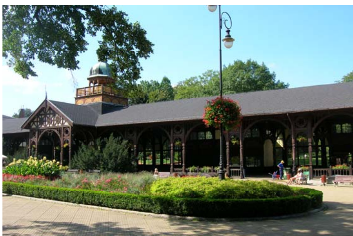
Fot. 1. Drewniane hale w Szczawnie Zdroju Phot. 1. Wooden hall in Szczawnie Zdrój

są to uzdrowiska zlokalizowane w rejonach górskich, gdzie naturalnym tworzywem wydaje się być drewno, niewielka część obecnie istniejących obiektów uzdrowiskowych wykonana jest w całości właśnie w konstrukcji drewnianej. Te, które doczekały naszych czasów, są niewątpliwie wyjątkowymi wręcz bezcennymi elementami tożsamości tych uzdrowisk. Obecnie funkcjonujące główne obiekty w konstrukcji drewnianej to hale spacerowe w Szczawnie Zdroju (fot. 1), Świeradowie Zdroju (fot. 2), Długopolu Zdrój (fot. 3) i dawna hala spacerowa, obecnie kawiarnia w Łądku Zdroju (fot. 4).