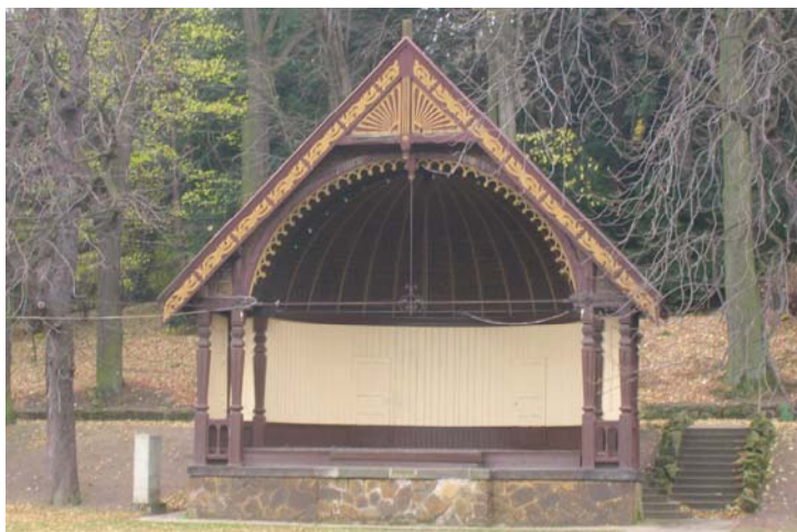
Fot. 5. Muszla koncertowa

latorni (obecnie restauracja „Legenda”) wybudowany w formie pawilonu, nawiązującego do wzorów orientalnych (fot. 6).