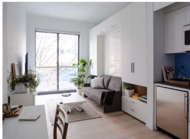
Il. 2. Wnętrze jednego z mikroapartamentów w Caramel Place. Widok ze złożonym łóżkiem.