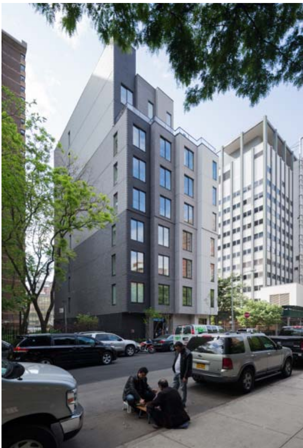
Il. 1. Caramel Place, NY.