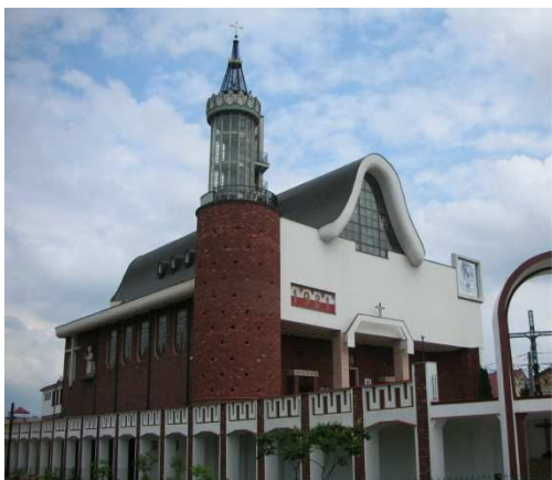
Ryc. 1. Kościół p.w. Św. Kazimierza Królewicza, arch. Jan Krutul (1983 – 1993)

Na terenie przyległym do świątyni w roku 1998 odsłonięto pomnik autorstwa Dymitra Grozdewa - Grób Nieznanego Sybiraka.