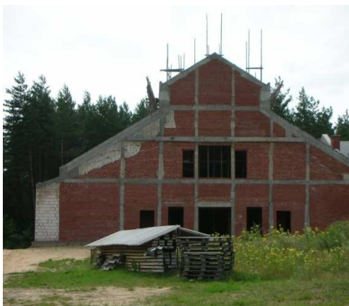
Ryc. 17. Kościół p.w. św. Józefa, arch. Arkadiusz Koca i Lecha Żendziana.