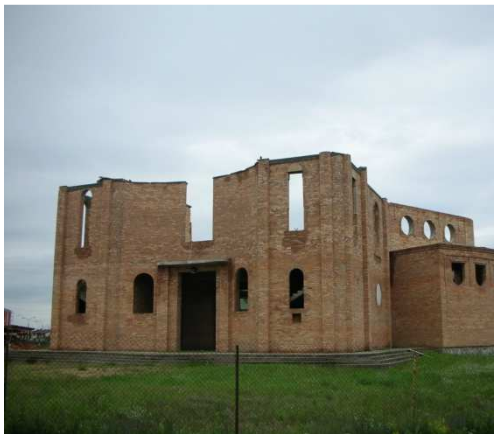
Ryc. 15. Kościół p.w. św. Karola Boromeusza, arch. Michał Bałasz, proj. 2000.