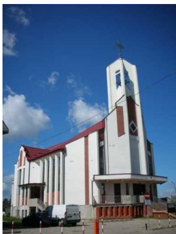
Ryc. 11. Kościół p.w. Św. Rodziny, arch. Danuta Łukasiewicz (1993)

się tym samym spośród wszystkich białostockich świątyń – stanowi bowiem romantyczną opowieść o architekturze „przedmodernistycznej”.