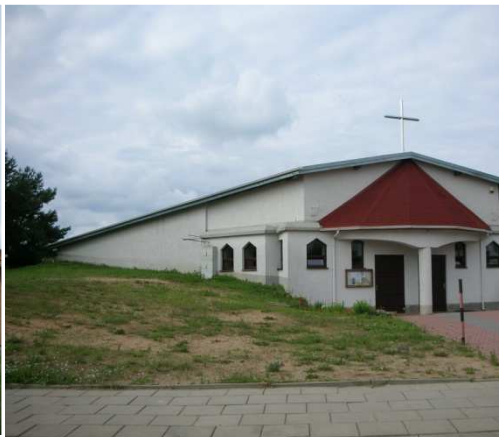
Ryc. 16. Kościół p.w. NMP Nieustającej Pomocy, arch. Andrzej Nowakowski, proj. 2000.