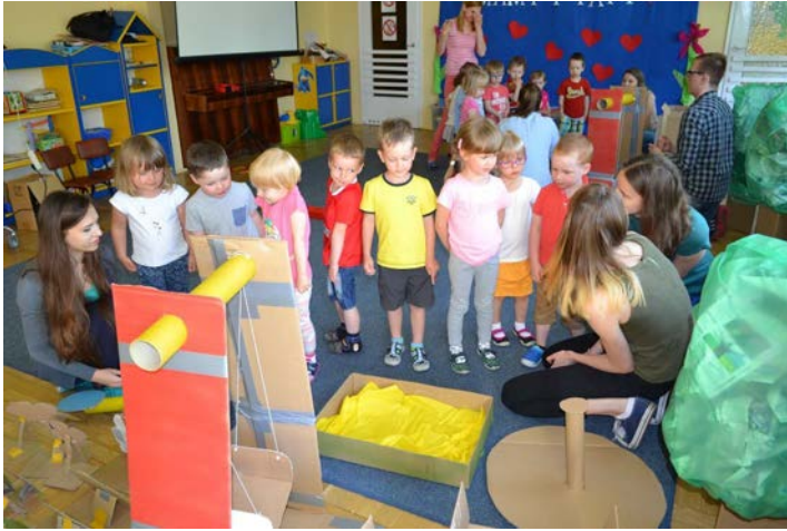
Fot. 4. Warsztaty zorganizowane przez członków AKNGP w jednym z poznańskich przedszkoli (wiosna 2016)