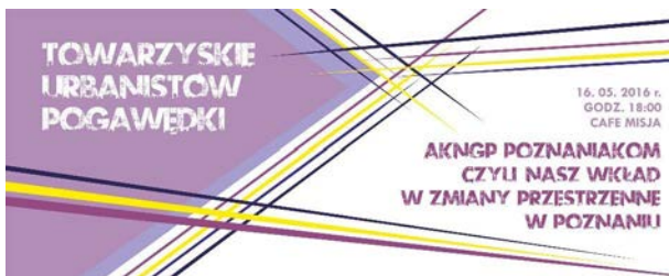
Ryc. 2. Plakat promujący pogawędkę z udziałem Akademickiego Koła Naukowego Gospodarki Przestrzennej

Wspólne wyjazdy integrujące studentów legły u podstaw AKNGP. W kolejnych latach z różną częstotliwością odbywały się podróże do różnych części Polski i Europy. Były one powiązane z działaniami inwentaryzacyjnymi i projektowymi, realizowanymi na zlecenie lokalnych samorządów. Niewątpliwie była to także okazja do zacieśnienia przyjaźni między członkami AKNGP, które wielokrotnie wytrzymały próbę czasu i wciąż łączą dawnych absolwentów kierunku gospodarka przestrzenna .