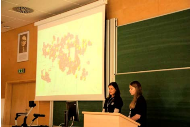
Fot. 2. Prezentacja działalności AKNGP podczas Urban Day 2015