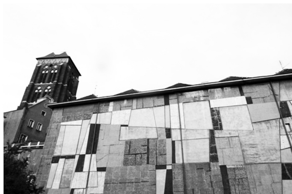
Fot. 2. Mozaika Anny Fiszer (fragment)