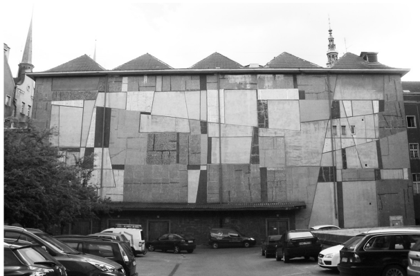
Fot. 1. Mozaika Anny Fiszer