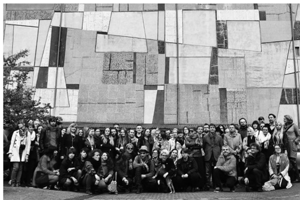
Fot. 5. Grupa obrońców mozaiki