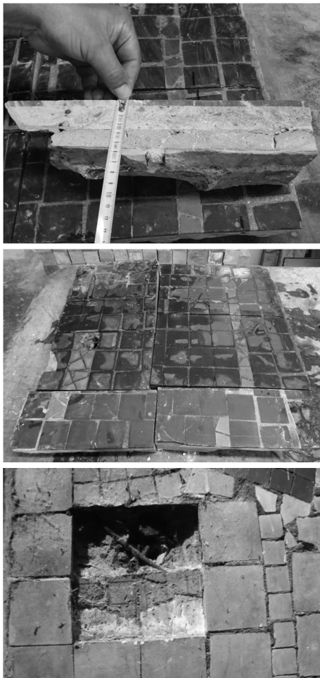
Fot. 6-8. Ekspertyza mozaiki Anny Fiszer Źródło: [B. Kotarska-Lewandowska, 2015] (fot. 6-8).

została) została przymocowana do ściany punktowo za pomocą długich gwoździ wbitych w spoinę muru [Wilde et al. 2015] (fot. 6-8).