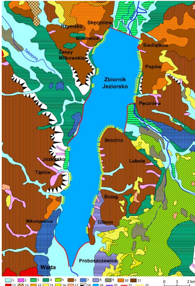
Rys. 2. Szkic geomorfologiczny okolic zbiornika Jeziorsko (na podstawie: Banach, Grobelska 2003; Forysiak 2005)