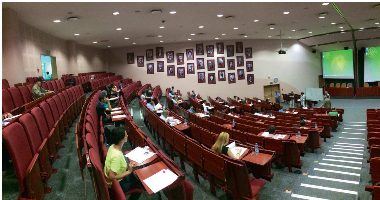
Ryc. 2 – Widok Auli w WUM z uczestnikami podczas wyjaśniania zasad zaznaczania odpowiedzi na przygotowanych szablonach